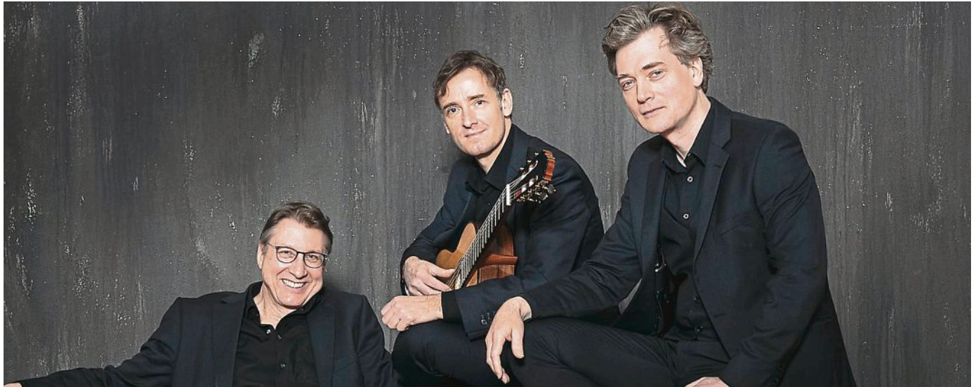
Das Gitarrentrio „Spain“ begeistert Kritiker wie Publikum stets auf das Neue.

Publikum wie Kritiker sind gleichermaßen begeistert von der Möglichkeit, in dieser ausgefallenen Besetzung