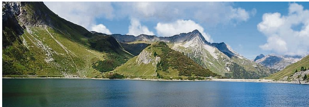
Der Spuller See in den Lechtaler Alpen.

■ Teilnahme am Stockturnier Einer der Höhepunkte im