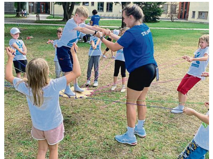
Ein Eindruck aus dem letzten Ferienprogramm 2023.