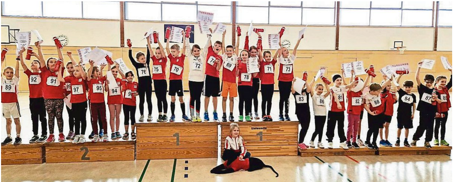
Drei Mannschaften auf dem Treppchen: Für Emmerings junge Leichtathleten war der Hallen-Wettkampf ein voller Erfolg.