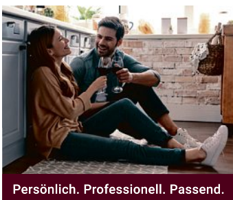
Persönlich. Professionell. Passend.

Ehrlichkeit uns selbst und unseren Kundinnen und Kunden gegenüber, gehört seit 40 Jahren zu den ehernen Grundsätzen bei wieserKüchen. Konkret bedeutet das: Erstklassige Beratung auf Augenhöhe und mit Fokus auf Ihre Traumküche. Wir sagen ehrlich, was geht – aber auch was nicht geht oder finanziell keinen Sinn macht. Schließlich ist ein Küchenkauf kein Spontankauf und Sie sollen viele Jahre lang mit Ihren Entscheidungen glücklich sein. Fordern Sie uns! Wir freuen uns auf Sie!