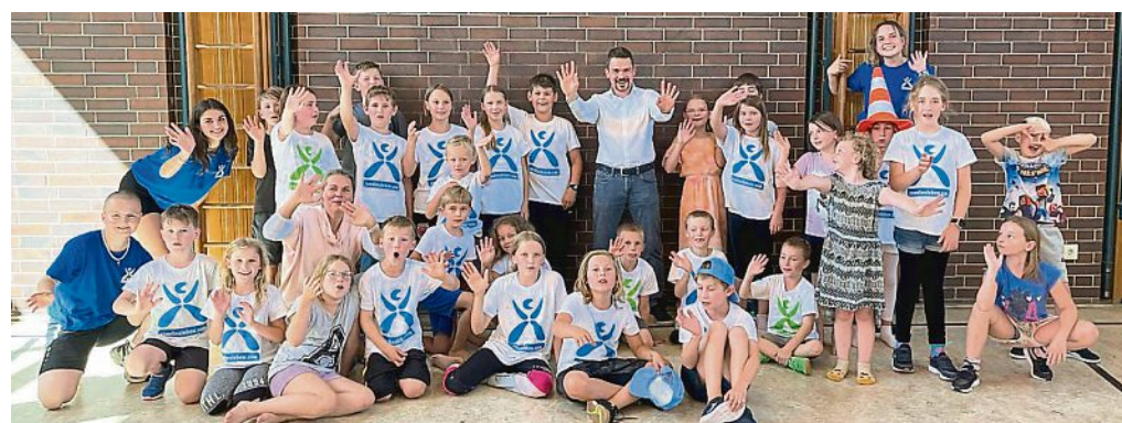
Das Ferienprogramm erfreute sich auch 2023 großer Beliebtheit.