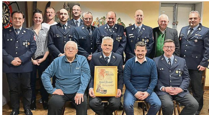
Die geehrten Mitglieder