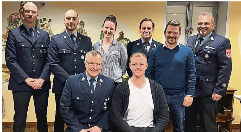
Die neue Vorstandschaft