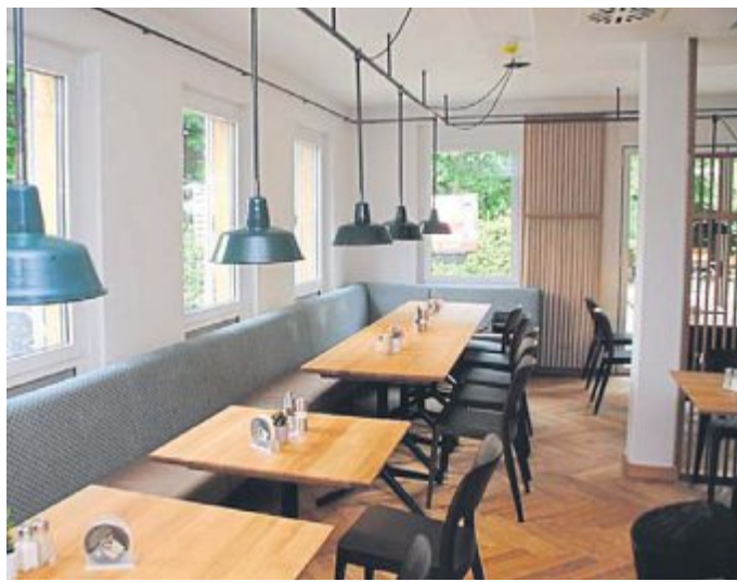
Alles neu im Bürgerhaus. Inventar und Fensterfassaden haben sich verändert.