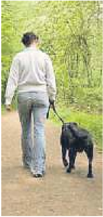
Vor allem im Hölzl herrscht strikte Anleinpflicht.