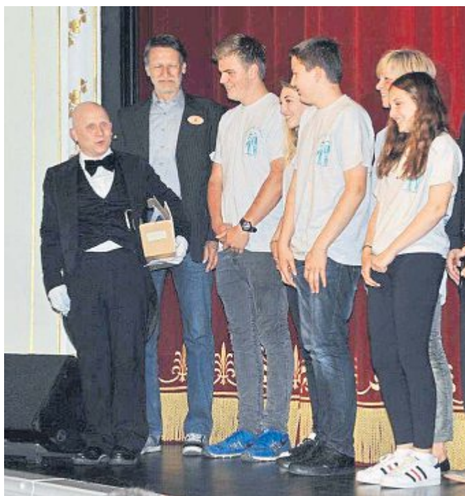
Die Ehrung wurde zum großen Festakt.