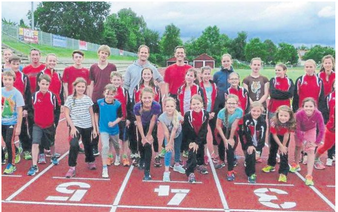
Der Weg ist geebnet, die Bahn frei. Am 8. Juli wird das neue Stadion eingeweiht.

Am Samstag, 9. Juli, findet auf der neuen Anlage ein Schülerwettkampf von acht bis 14 Jahre zwischen verschiedenen Sportvereinen statt. Am Sonntag, 17. Juli, veranstaltet der TVE die jährliche Abnahme des deutschen Sportabzeichens (s. Kasten rechts).