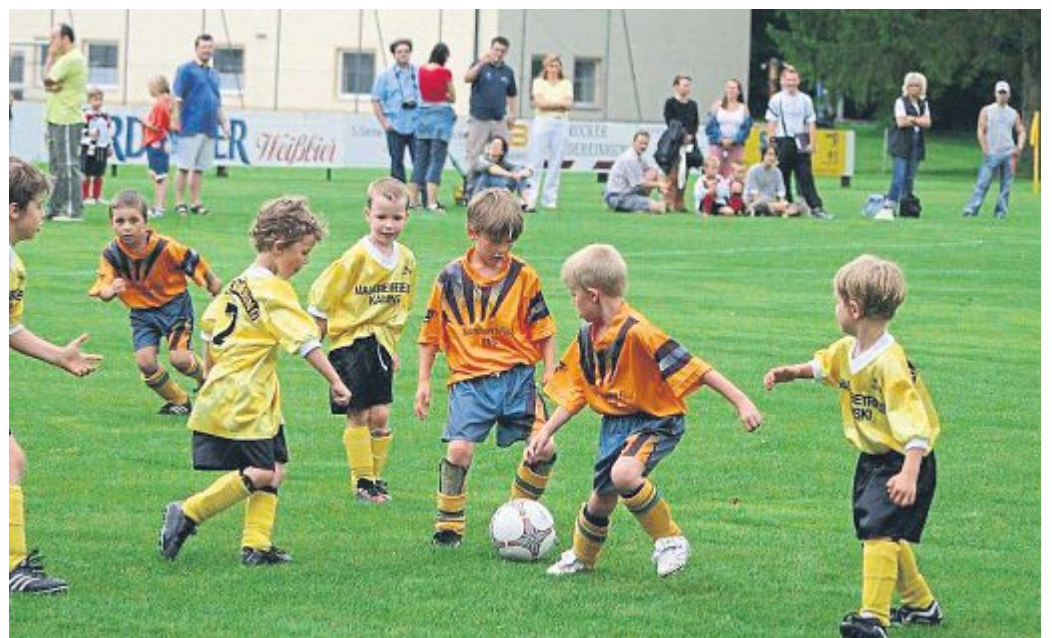
In der Hölzl-Arena tobt drei Tage lang der Fußball.

Der FC Emmering erwartet an diesem Wochenende 70 teilnehmende Mannschaften mit in Summe rund 800 jungen Fußballern. Neben dem Spielen gibt es auch noch ein Torwandschießen und Geschwindigkeitsschießen für jedermann.