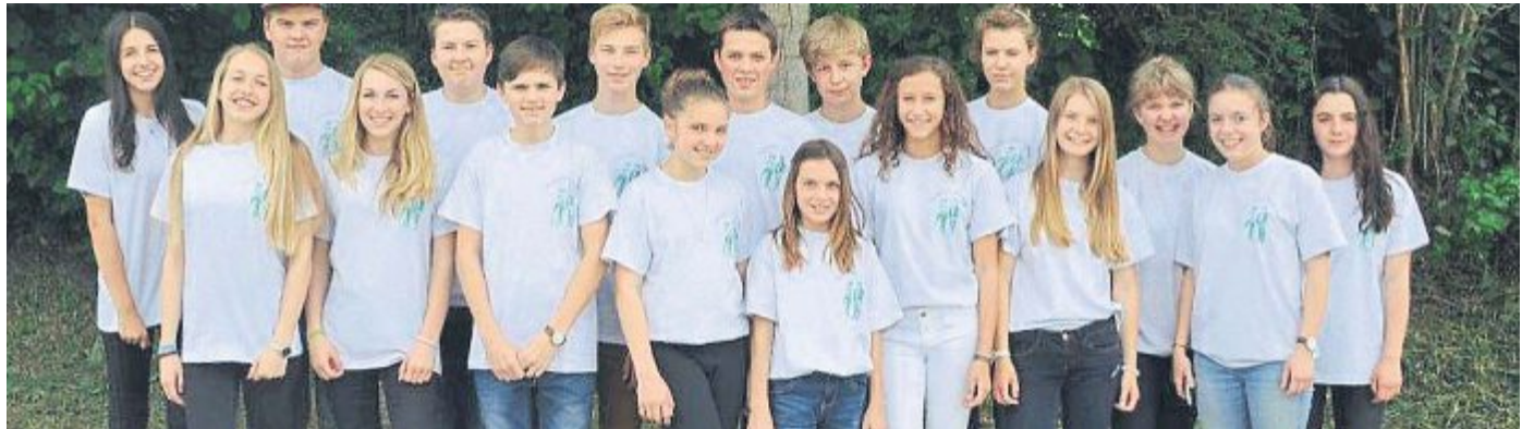
Eine 30-köpfige Delegation hatte sich der Preisverteilung nach Neuburg (Donau) aufgemacht.