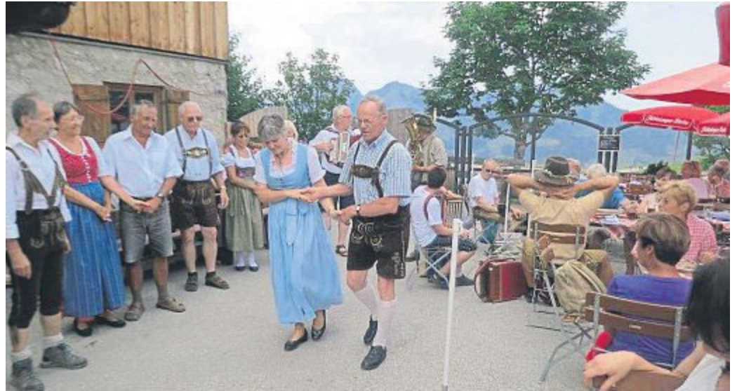
Tanz vor der Berghütt. Der Volksmusik-Ausflug ist stets stark frequentiert.

Ab Mittag wird die „Emmeringer Wirtshausmusi“, bekannt durch den Musikantenstammtisch im Gasthaus Grätz, zu einer abwechslungsreichen Unterhaltung sorgen. Volksmusikanten aus dem nahen und weiten Umkreis von Emmering werden wieder ihr Können hauptsächlich auf der Steirischen präsentieren.