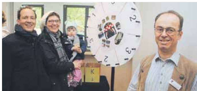
Rege genutzt wurde das Glücksrad.