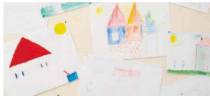
Ein Malwettbewerb lockte die Kinder an.