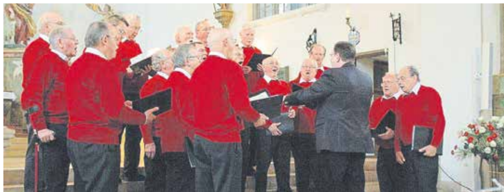
Der Männerchor in der katholischen Kirche.