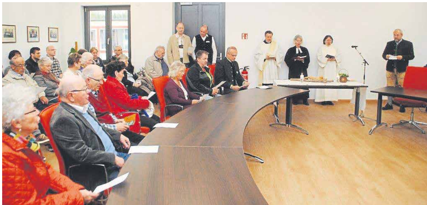
Die ökumenische Weihe war der Höhepunkt des Tages im neuen Sitzungssaal.

Höhepunkt beim Tag der offenen Tür war die ökumenische Weihe des Hauses durch die Vertreter der evangelischen und katholischen Kir-