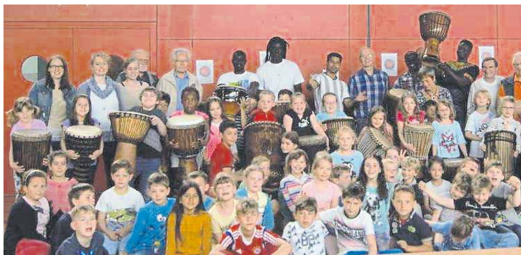
Mitgerissen wurden die Teilnehmer von fetzigen Rhythmen.

Zum Aktionstag in Bayern trafen sich in der Grund- und Mittelschule Fürstenfeldbruck-Nord alle Zweitklässler mit der Trommlergruppe „Diappo“ aus Emmering – Asylanten aus dem Senegal – sowie dem Männerchor zu einem gemeinsamen Workshop mit Trommeln und Singen. Mit ethnischen, fetzigen Rhythmen und afrikanischen Gesängen wurden alle Teilnehmer mitgerissen und machten gemeinsam begeistert Musik.