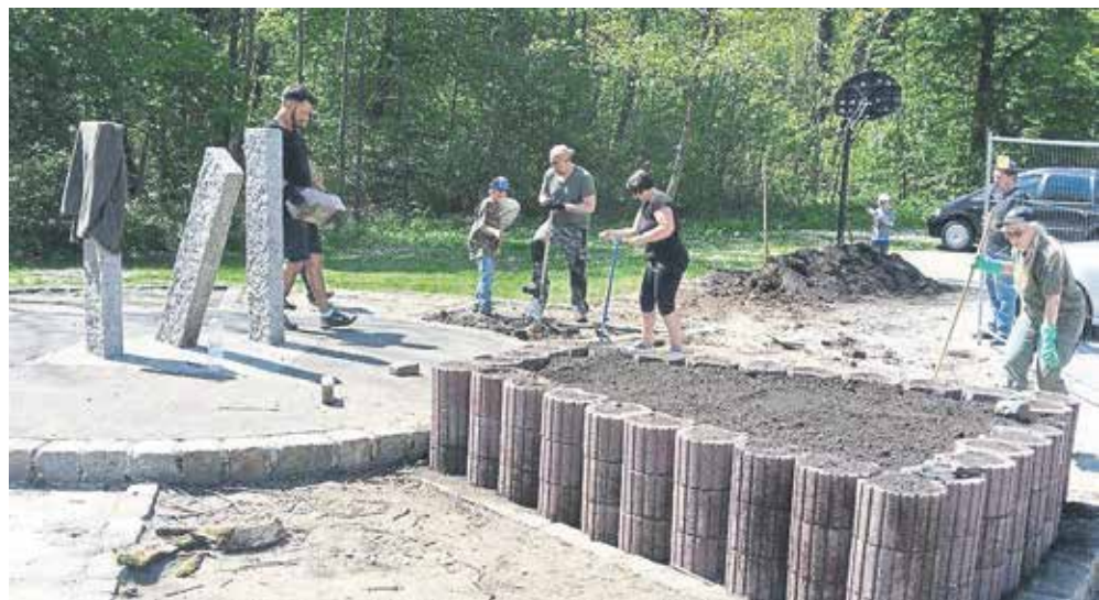
Fleißige Eltern Der Elternbeirat der Grund- und Mittelschule hat im Pausenhof Unkraut gezupft, Bänke gestrichen, die Bodenbemalungen nachgezogen, Beete für die Bepflanzung vorbereitet und ein Hochbeet gebaut. Im ehe- maligen Barfußpfad sollen jetzt Schulklassen mit ihren Lehrkräften Gemüse, Kräuter, Obststräucher und Blumen anpflanzen können.