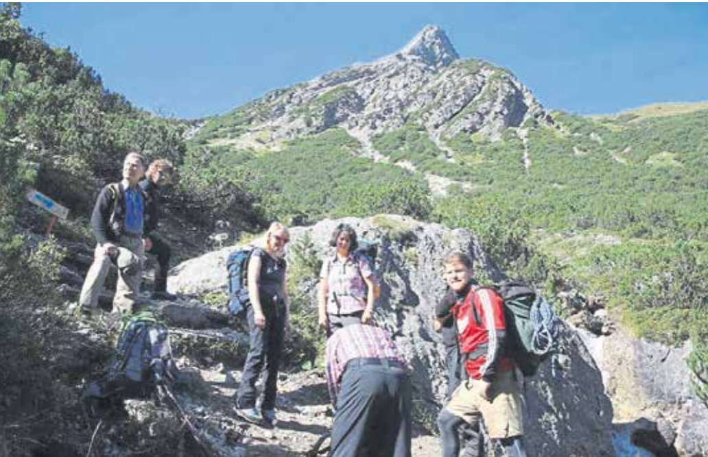
Bergwanderungen gehören fast jedes Wochenende zum festen Programm.