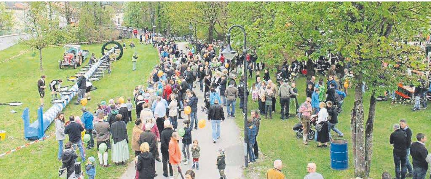
In Scharen drängten sich die Besucher um noch flach liegenden Maibaum. Als er senkrecht stand, wurde kräftig gefeiert.