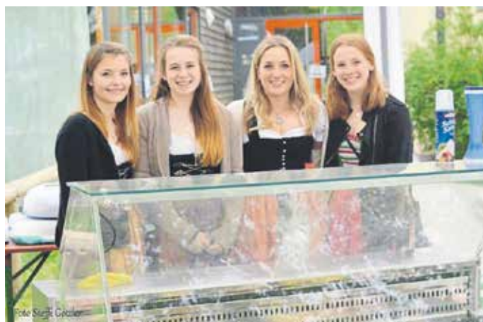
Auf fesche Mithilfe vom Madlverein konnten die Burschen nicht verzichten.