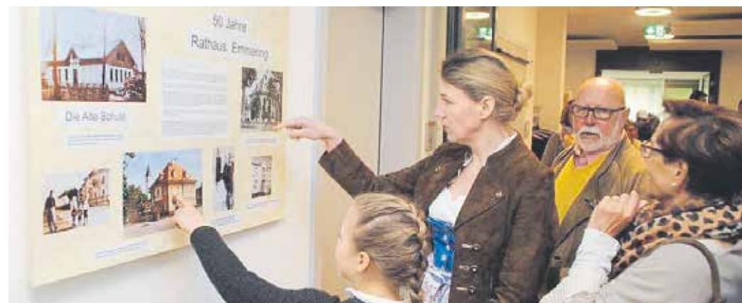
Eine Ausstellung zeigte die Ortsgeschichte.