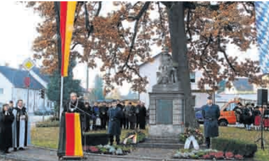
Festlich geschmückt präsentierte sich das Kriegerdenkmal am Volkstrauertag.