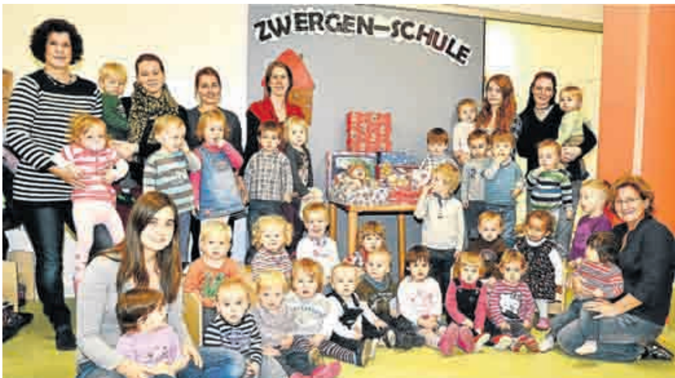
Die Weihnachts-Aktion der Denk-mit-Kinderkrippe fand großen Zuspruch.

Man stellt sich das so schön vor: Der erste Schnee fällt sanft aus den Wolken in unseren Garten, die Kinder drücken sich die Nase an den Fensterscheiben platt. Mit viel „ah“ und „oh“ zeigen die kleinen Händchen immer wieder nach draußen und machen die Erzieherinnen auf das erstaunliche Weiß aufmerksam. Dann werden die Kinder warm und schneesicher eingepackt. Ungeduldig warten die Ersten auf die Letzten, und die Erzieherinnen müssen aufpassen, dass die einen nicht wieder aus-, bevor die anderen angezogen sind. Endlich geht's hinaus. Für manche Kinder ist es das erste Mal, dass sie Schnee bewusst erleben können. Aber der Schnee ist kalt und diese lästigen Handschuhe will man gar nicht anlassen. Lieber ohne in die neue, unbekannte Materie greifen. Dabei werden die Händchen sehr schnell kalt. Und statt trockenem Pulver fällt nasser Pappschnee. Die Anzüge weichen schnell durch, außerdem ist es rutschig zum Laufen. Schnee kommt von oben in die Schuhe, und überhaupt kann dieses interessante Weiß ganz fürchterlich sein. Weinend hängt man bei der Erzieherin auf dem Arm und gibt erst wieder Ruhe, wenn man alles Nasse ausgezogen bekommen hat und in der warmen Krippengruppe angekommen ist. Dann kann man auch wieder am Fenster stehen und mit viel „ah“ und „oh“ das lustige Tanzen der Schneeflocken draußen kommentieren.