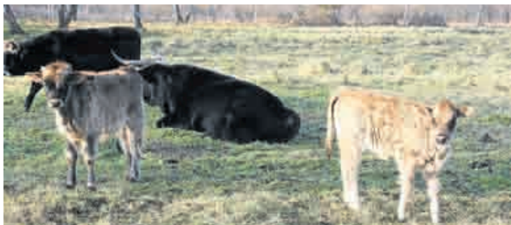
Die in diesem Jahr im Fußbergmoos geborenen Heckrinder-Kälber „Achat“ und „Estrella“ suchen Paten, die mithilfe die im Winter notwendige Zusatzfütterung zu finanzieren.

Die mittlerweile achtköpfige Rinderherde hat im Frühjahr, Sommer und Herbst die Aufgabe, den natürlichen Aufwuchs klein zu halten. Wenn dies nicht erfolgt, verändert sich im Laufe der Zeit Fauna und Flora, weil der