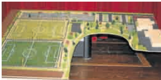
Im Modell ist die neue Sportanlage schon fertig.

Nachdem der FCE im Sommer in Eigenleistung den ge-