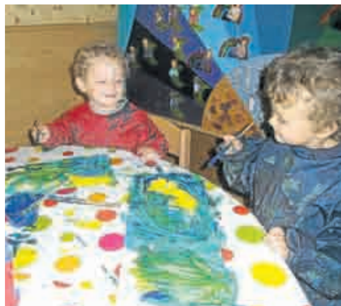
Nach Herzenslust wird Unterm Regenbogen gemalt.

Bunt wie der Herbst in seinen leuchtenden Farben. Im evangelischen Kindergarten Unterm Regenbogen wird das ganze Jahre der Kunst gewidmet. So ist zurzeit das Kinderatelier geöffnet. Dort kann nach Herzenslust gemalt und experimentiert werden. Es entstehen die ersten Kunstwerke, nebenbei lernen die Kinder Wissenswertes über die Farben und den Farbkreis, mischen was das Zeug hält und werden dabei auch selbst manchmal ein bisschen „bunt“. In der Vorweihnachtszeit stehen die Werke von Friedensreich Hundertwasser im Mittelpunkt.