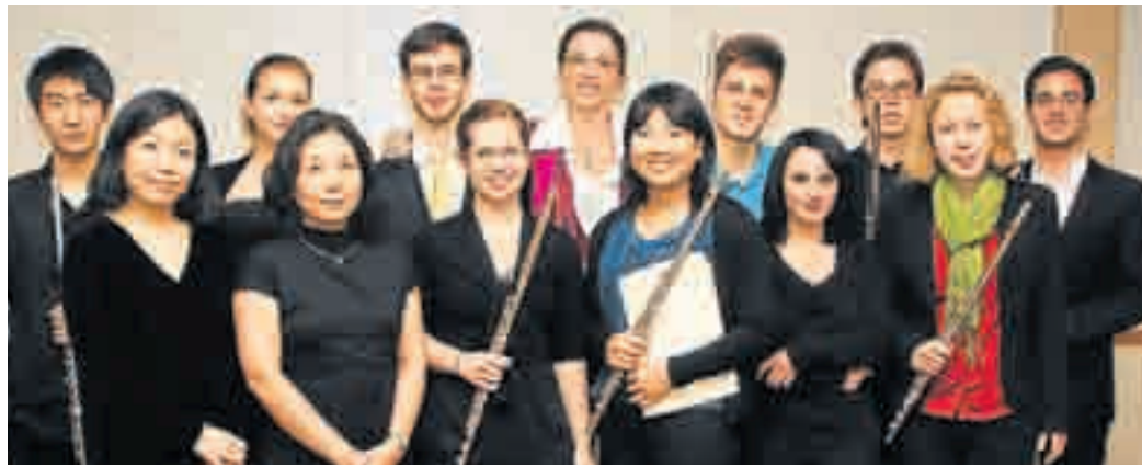
Das Podium für junge Künstler war heuer für eine Flötenklasse reserviert.

Land steckt diesen Vortrag in ein vergnügliches bayrisches Gewand, nicht ohne Seitenblicke auf populäre Schlager- und Opernmelodien. Musikalisch wird der Abend von der Greilinger Tanzbodenmusik, der Spielmusik Tölzer Land und dem Duo Kloiber/Janßen umrahmt. Albert Holzer verbindet die verschiedenen Teile des Abends mit humoristischen G'schichtln und Versen.