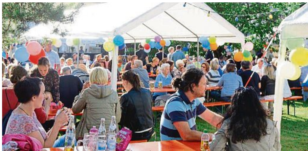
Wie gewohnt viele Besucher kamen zum Gartenfest der CSU.

leert und der abendliche Teil des Gartenfests konnte beginnen, umrahmt von Musik der Gruppe „Die Bayroler“. Bratwurst, Halsgrat und Käseteller, dazu ein kühles Bier oder Anderes von der Getränkekarte lockten zum Bleiben und Genießen. Erst gegen 22 Uhr hatte Petrus kein Einsehen mehr. Aber trotz Regen blieb noch mancher da, denn man hatte sich schon gemütlich an der Cocktailbar positioniert. Rund herum sind die Veranstalter sehr zufrieden mit dem Verlauf des Festes.