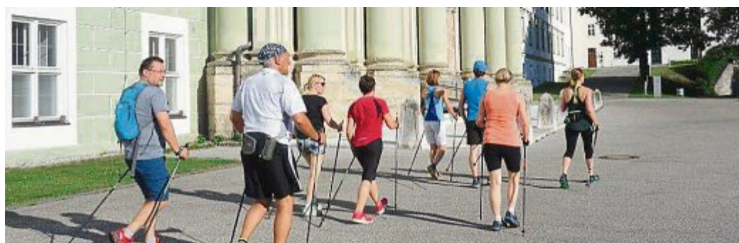
Nordic Walking entlang des Kloster Fürstenfeld.

Infos und Anmeldungen unter Telefon (0 81 41) 4 46 15 oder im Internet unter www.skiclub-emmering.de