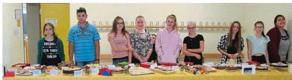
Probekochen Schülerinnen mit der Fachrichtung Soziales haben Projektmappen erstellt und mit Erstklässlern ausgewählte Gerichte gekocht. Es gab beispielsweise Blechkartoffeln mit Dip oder Pizzabrötchen usw. Nach der Arbeit verpeisten sie zusammen ihr Mahl.