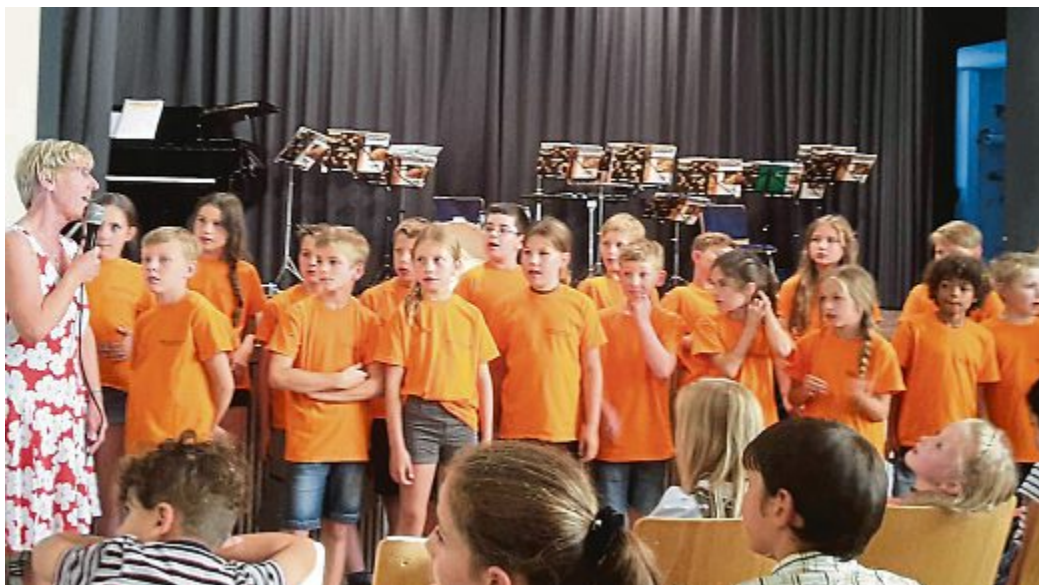
Bravo-Rufe aus dem Publikum für die Teilnehmer am Sommerkonzert.