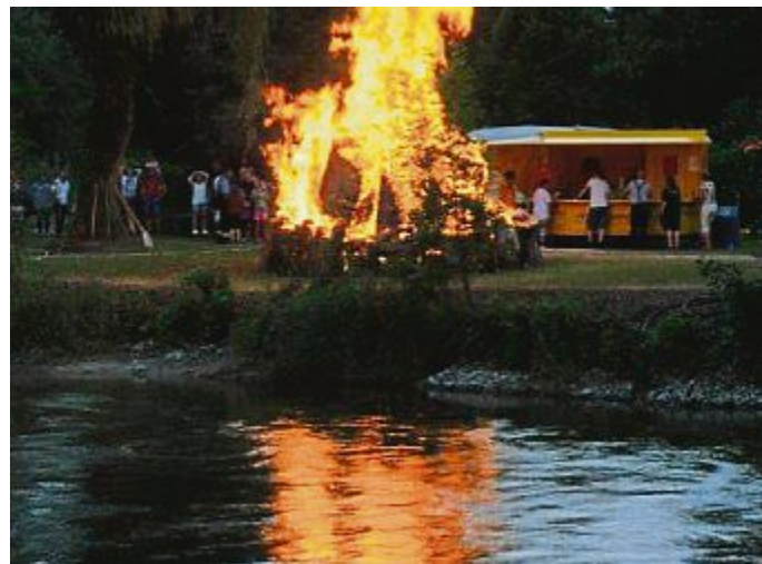
...wurde das Sonnwendfeuer entzündet.