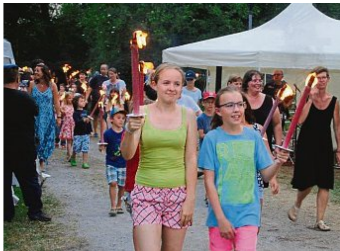
Nach dem Fackelzug der Kinder...