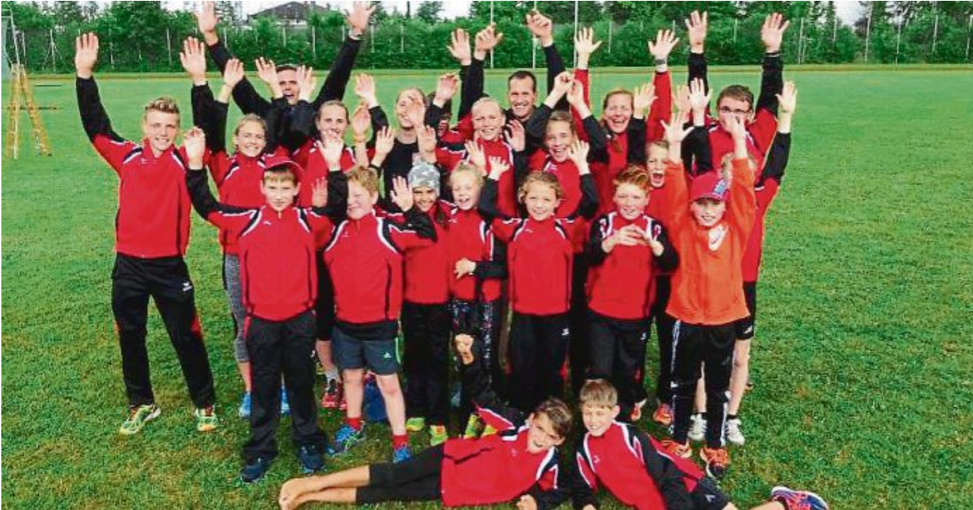
Eine große Schar mit TVE-Leichtathleten war bei der Kreismeisterschaft in Planegg vertreten.