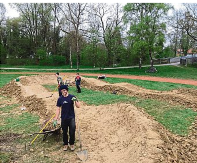
Die Bauarbeiten dürften Ende Juli abgeschlossen sein.