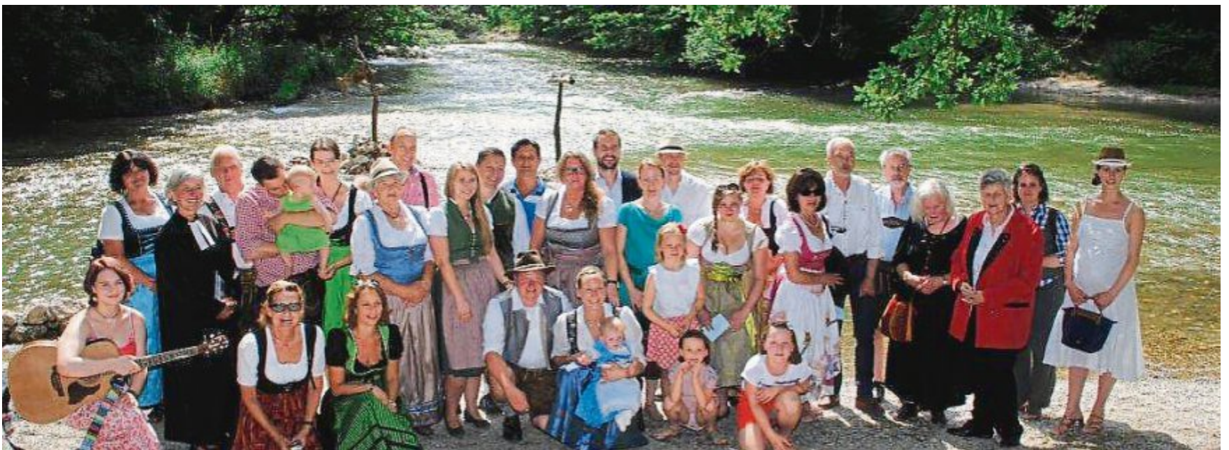
Verwandte, Freunde und Bekannte verfolgten die seltene Taufzeremonie im Emmeringer Hölzl.

Dienstag, 25. Juli 2017 • Internet: www.emmering.de • E-mail: gemeinde@emmering.de • Fax (08141) 40 0744