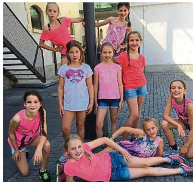
Tanz der Schülerinnen Die Sieger des Talentwettbewerbs der Grund- und Mittelschule, die Mädchen aus der Klasse 4a, traten mit ihrem Tanz zum Lied „Tik Tok“ von Kesha im Brucker Veranstaltungsforum auf.