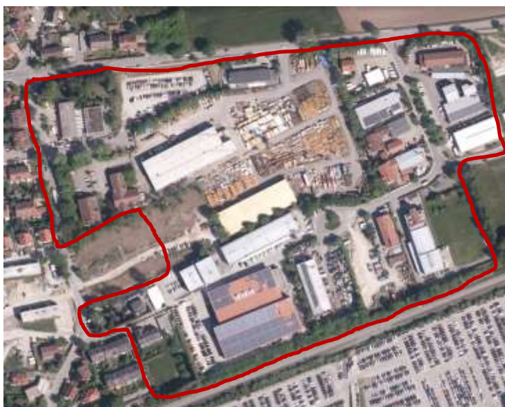
Abb.: Lage des Planungsgebiets, ohne Maßstab

Um das Ziel der stärkeren Wohnnutzung im Westen des Planungsgebiets weiter umzusetzen, wird ein Teilbereich in ein allgemeines Wohngebiet umgewandelt. Hierfür wird ein selbständiger vorhabenbezogener Bebauungsplan in einem eigenen Verfahren aufgestellt.