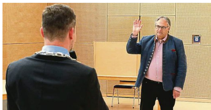
Werner Öl (r.) wurde als 3. Bürgermeister vereidigt.