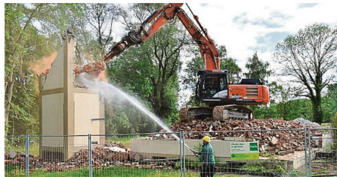
Zu guter Letzt musste auch der Turm dem Bagger weichen. Innerhalb einer Woche hat dieser alles platt gemacht.