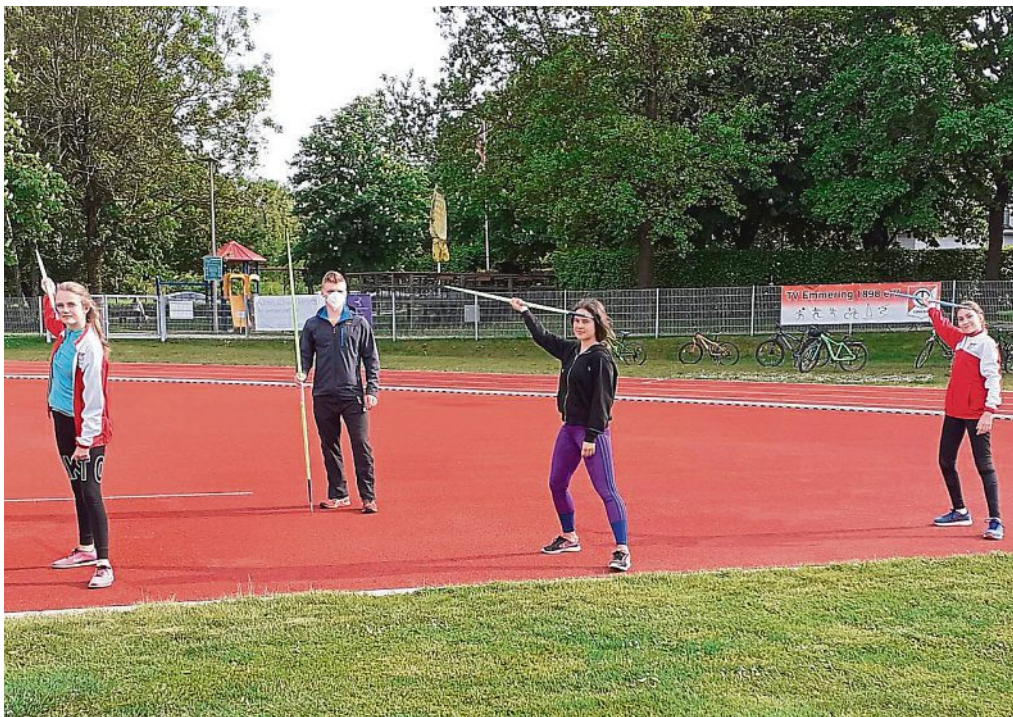
Mit Abstand am besten funktioniert auch Speerwurf-Training in Corona-Zeiten.