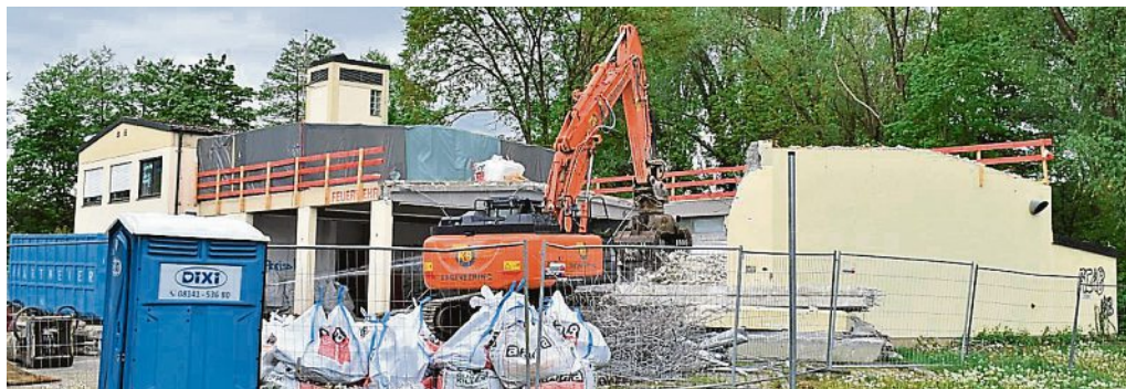
Anfang Mai wird das Feuerwehrgerätehaus Stück für Stück abgerissen und innerhalb weniger Tage dem Erdboden gleichgemacht.