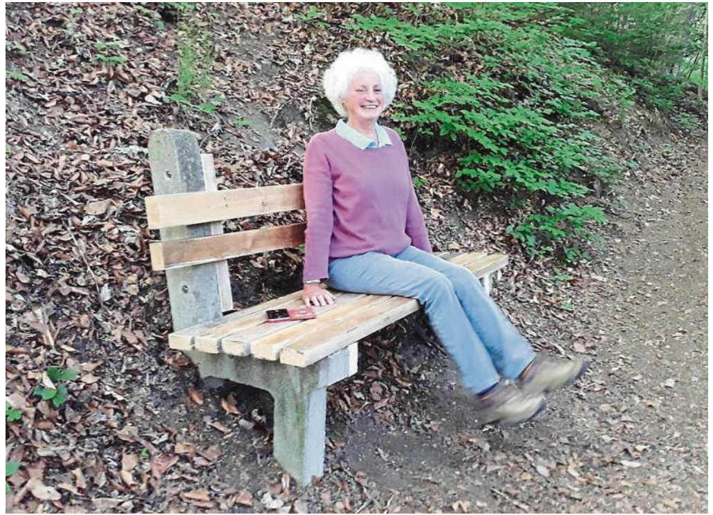
Die Sitzbank auf der Emmeringer Leiten wurde repariert ... und kann wieder benützt werden.