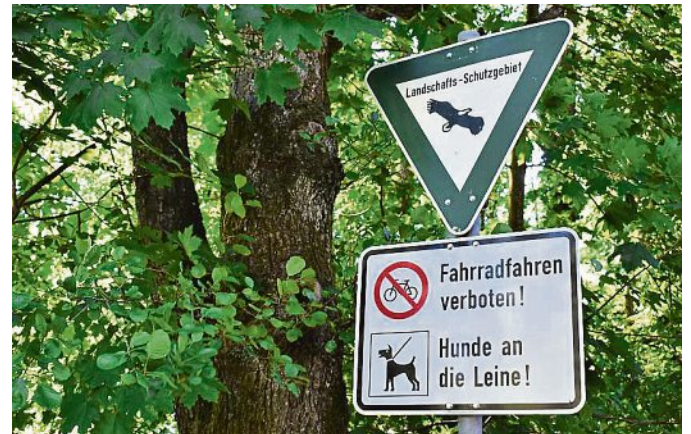
Das Hölzl ist ein Landschaftsschutzgebiet.

Das Hölzl ist ein Landschaftsschutzgebiet. Die Regeln sind: Keine Fahrradfahrten, Hunde an die Leine!