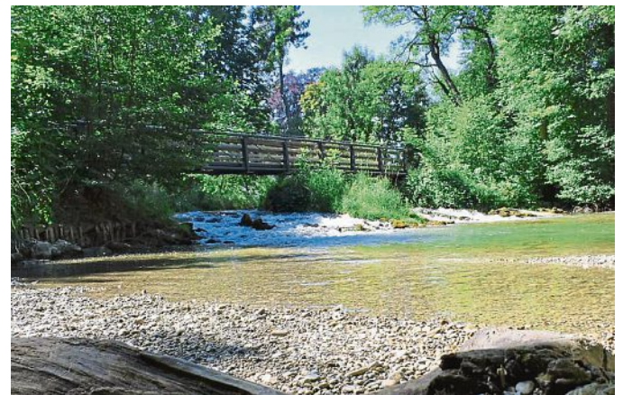
Verwunschen: eine Brücke im Hölzl.