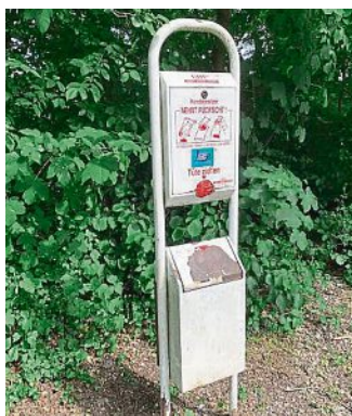
Hundetoiletten stehen in Emmering bereit.

Zum einen donnern Radler durchs Unterholz und über die Wege, verärgern Fußgänger, benehmen sich ggf. recht rabiatisch und das alles in einem Gebiet, welches für Radler komplett gesperrt ist. Schon seit Jahren besteht ein absolutes Fahrradfahrverbot und eine Rechtsverordnung zum Schutz des Landschaftsbestands. Ein weiteres Thema sind die frei laufenden Hunde. Liebe Hundebesitzer: An den Eingängen zum Emmeringer Hölzl stehen Schilder, die auf die Leinenpflicht hinweisen. Freilaufende Hunde vertreiben die Tiere, die im Emmeringer Hölzl heimisch sind. Außerdem sammeln Sie bitte die Exkremente Ihrer Hunde auf und entsorgen diese ord-