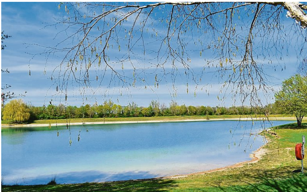
Idyllisch: der Emmeringer See.

Dienstag, 23. Juni 2020 • Internet: www.emmering.de • E-Mail: gemeinde@emmering.de • Fax (0 81 41) 40 07 44